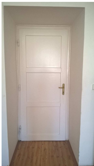
Fotografie – navrhovaný stav (standard provedení)