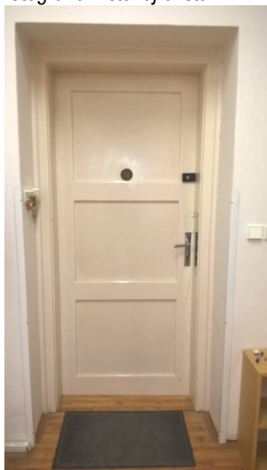
Fotografie – stávající stav