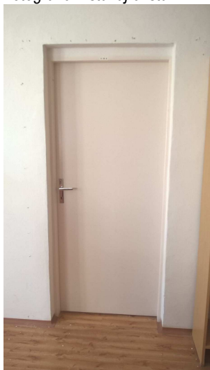
Fotografie – stávající stav