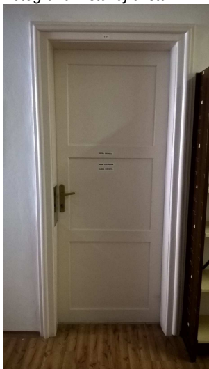
Fotografie – stávající stav