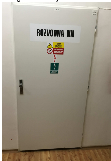
Fotografie – stávající stav