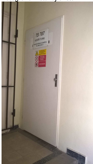
Fotografie – stávající stav